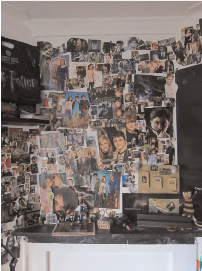
Figuur 3 Harry Potter-bricolage met religieuze elementen op kinderkamer