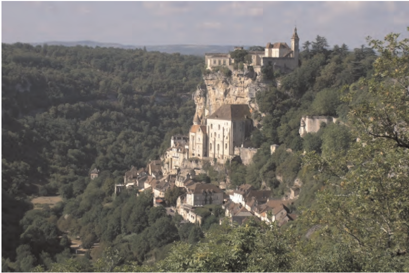
Figuur 14 Rocamadour

mes en heren, namelijk gaan afronden en wil, ook met enkele persoonlijke woorden, nog enige getuigenissen doen.