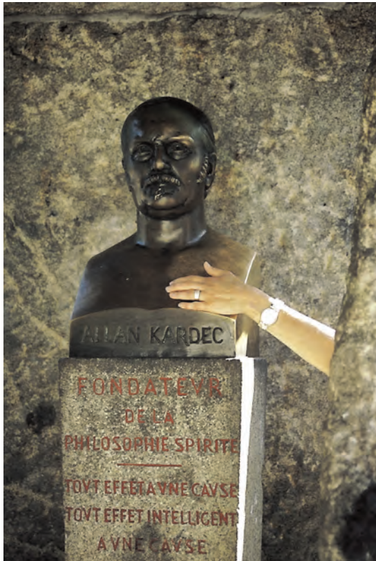
Figuur 1 Buste van Allan Kardec op zijn graf in Parijs

duidelijk dat religieuze vormen die op het zelf zijn toegesneden, juist zo populair konden worden in een cultuur die steeds sterker op het individu georiënteerd raakt. Waar eerder de traditionele kerken een catechetisch en generiek vangnet rond leven en dood boden, inclusief de morele en psychische ankerpunten, daar moet nu de mens zijn positie zelf definiëren. Michael York noemde dat de ‘self-conscious spiritualization of the human potential’. 15 Iets dat Otto dus ook al had opgemerkt.