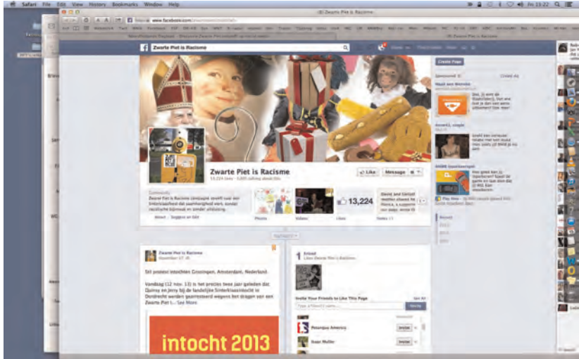
Figuur 13 a en b Facebookpagina's 'Piet is Racisme' en 'Pietitie'

tureel-familiair gestuurde overdracht als met de navelstreng verbonden met dit feest. Het heet dat als er één feest in de Nederlandse genen zit – zo u wilt: in het bloed zit – dat het Sinterklaasfeest is, dat immers sinds de middeleeuwen onafgebroken als familiefeest wordt gevierd. 101