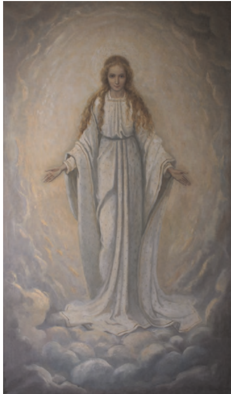
Figuur 8 Schilderij van de verschijning van Moederke van Welberg

ders; de berichtgeving bracht een stoet van honderden geestelijken, bisschoppen, abten, pastoors, paters, zusters en nog veel meer devotees op de been naar Welberg, teneinde daar via strikt gedoseerde audiënties Neerlands intermediair met de hemel te mogen aanschouwen.