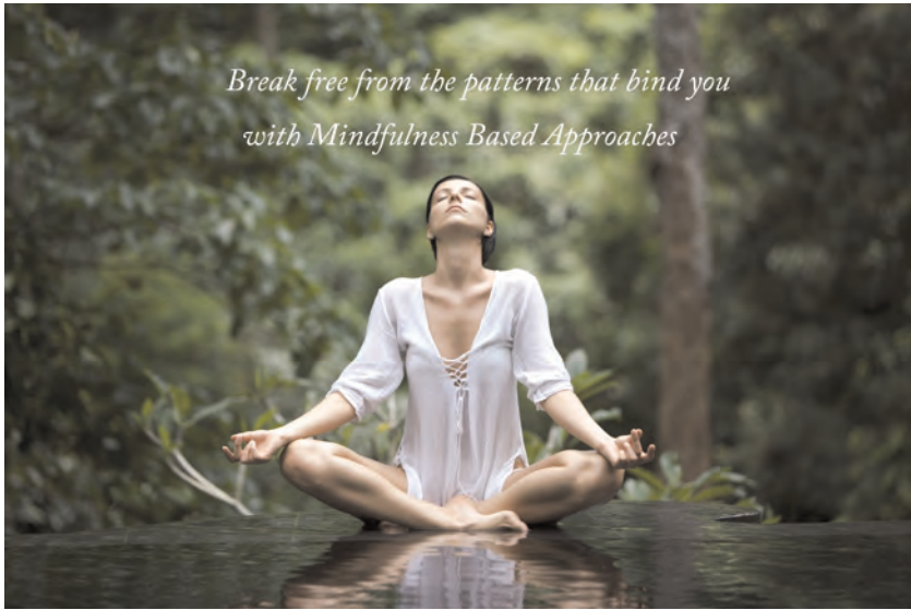
Figuur 2 'Mindfulness'

ciete, onzichtbare of schijnbaar triviale vormen van religiositeit en zingeving in het dagelijks leven. Ik gaf al aan dat, waar eerder de traditionele kerken een catechetisch en haast holistisch vangnet rond leven en dood boden, inclusief morele en psychische ankerpunten, de mens daar nu zijn positie zelf moet definiëren. De subjectivering van de levensparadigma's heeft die positie verandert. De mens zoekt nu bij de verwerking van en bij de omgang met het onheil steun in uiteenlopende vormen van impliciete religiositeit, alternatieve religies, irreguliere geneeswijzen, de cultus van het rolmodel of in nieuwe gepersonaliseerde vormen van rouw en memorialisering of herinnering van onderaf.